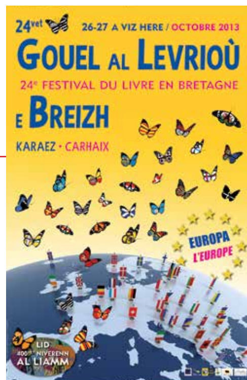
Skritell Gouel al Levrioù e Karaez.

Saloñs al Levrioù, d'ar Sadorn 26 ha Sul 27 a viz Here, e Karaez.