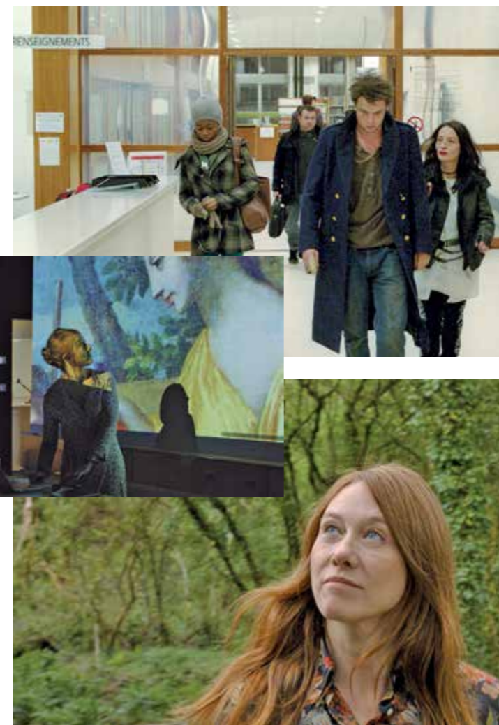
Pep gwir m'inet strizh.

Div eurvezh hanter e pad Suite armoricaine , ur badelezh divoas evit ur film war lez ar sinema dizalc'h, hep aktor brudet ebet. Gant ur budjed bihan e tiskouez Pas-