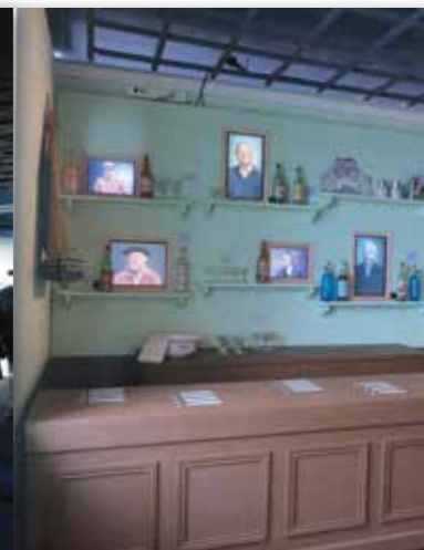
Diskouezadeg nevez Porzh-Mirdi Douarnenez.

B rudet a-walc'h eo kêr Douarnenez evit tavarnioù niverus porzh ar Rosmeur hag an aergelc'h laouen a vez enno ingal, gant sonerezh ha festoù liesseurt. Padal, an tavarnioù-se zo pell-mat diouzh ar pezh e oant tri-ugent vloaz zo pe belloc'h c'hoazh, ha kalon an diskouezadeg eo istor an emdroadur-se.