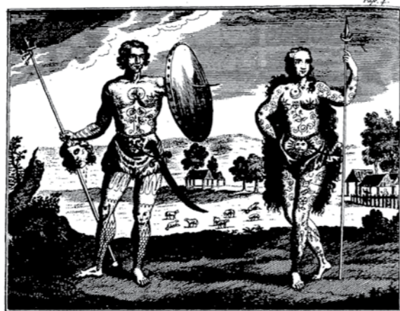
Ur brezelour hag ur vrezelourez pikt treset e 1739 gant James Robinson.

Ar Bikted, sed aze ur bobl gelt hag he deus lakaet an istorourien (ha tud all) da zuañ paper diwar o fenn. Brezelerien ferv anezho aet da get pell zo bremañ. Aet da get gwir eo, met evit pe abeg ?