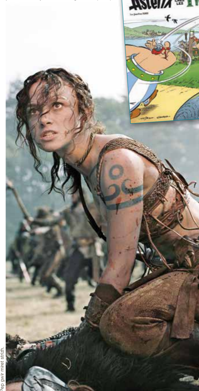
Pep gwir miret strizh.