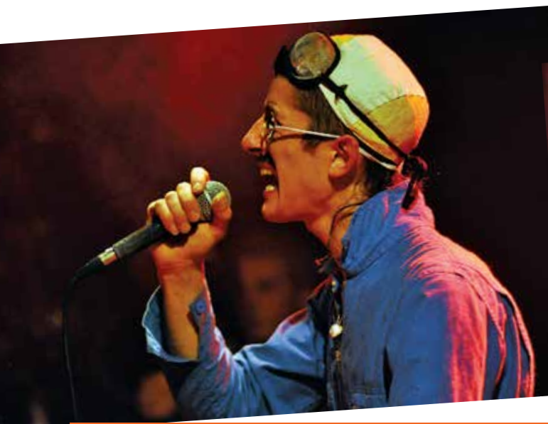
El Maout war al leurenn. sk. © Gael Fontana/gaelfontana.com