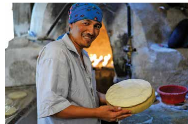
Setu ar c'hleb ( kleb ) a boazher e-barzh ur forn. Kavet e vez ar bara ront-se e pep lec'h er vro.