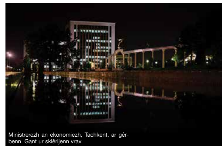
Ministrerezh an ekonomiezh, Tachkent, ar gêrbenn. Gant ur sklêrijenn vray.