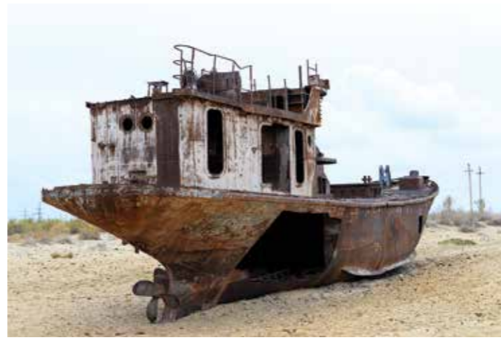
Mor Aral, un devezh m'edon e Mo'ynoq. Div eurvezh taksi zo ac'hano da Nukus. Ur porzh e oa n'eus ket pell zo. Trist eo ha fentus diouzh un tu all.