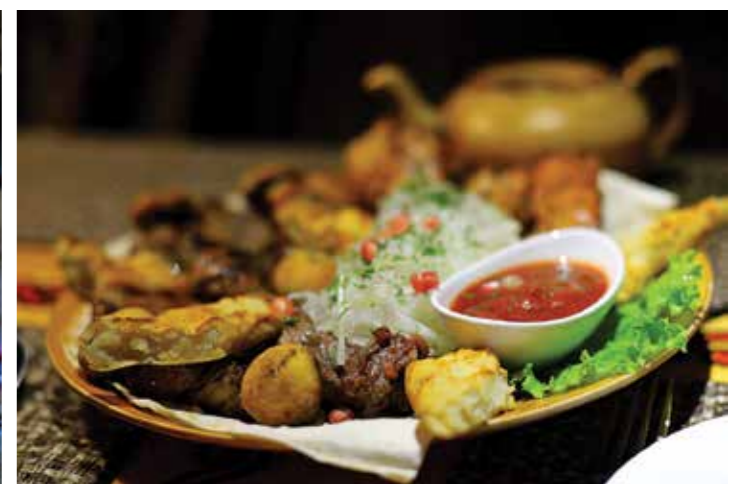
Ur vro baour eo met puilh eo ar meuzioù.