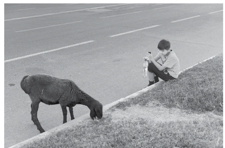
Ur vro etre hengoun ha modernelezh. Ar paotrig-se zo ur pellgomzer hezoug gantañ en e zorn met dav eo dezhañ ober war-dro e loen...