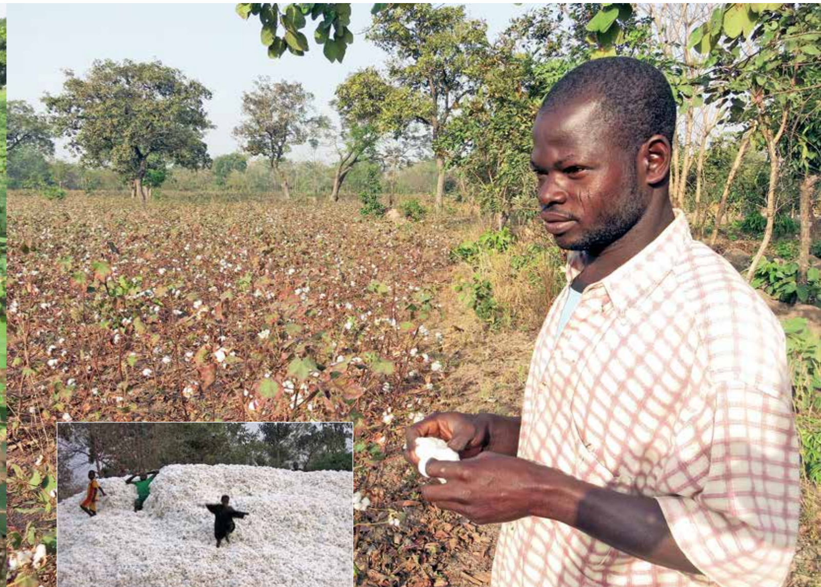
Bugale o c'hoari en ur bern kotoñs.